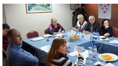
Волинська, Рівненська, Одеська, Чернігівська, Луганська та Донецька області розпочали роботу із впровадження ГОБ на місцевому рівні

4 - 5 жовтня у Хмельницькій області відбулась розширена нарада щодо результатів роботи робочих груп з впровадження гендерно-орієнтованого бюджетування в галузі освіти. У «кластерній» нараді взяли участь керівники Хмельницької області, представники Міністерства фінансів України, Міністерства освіти і науки України, а також представники департаментів фінансів, освіти і науки та інших департаментів Хмельницької, Львівської, Чернівецької, Івано-Франківської, Волинської, Рівненської, Закарпатської, Тернопільської та Житомирської облдержадміністрацій, журналісти.